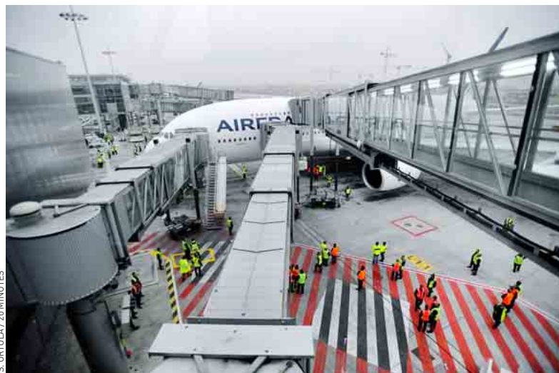
Plus de 20 millions d'euros manqueraient dans les comptes du CCE de l'avionneur.

Ce trou « inexplicable » relèverait, pour 95 %, d'une mauvaise gestion et pour 5 %, d'un possible enrichissement personnel, d'après Le Figaro . Le quotidien évoque des dépenses non justifiées avec