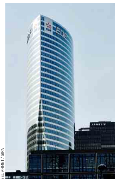
Le CE d'EDF avait été mis à l'index par la Cour des comptes en 2005 et 2007.